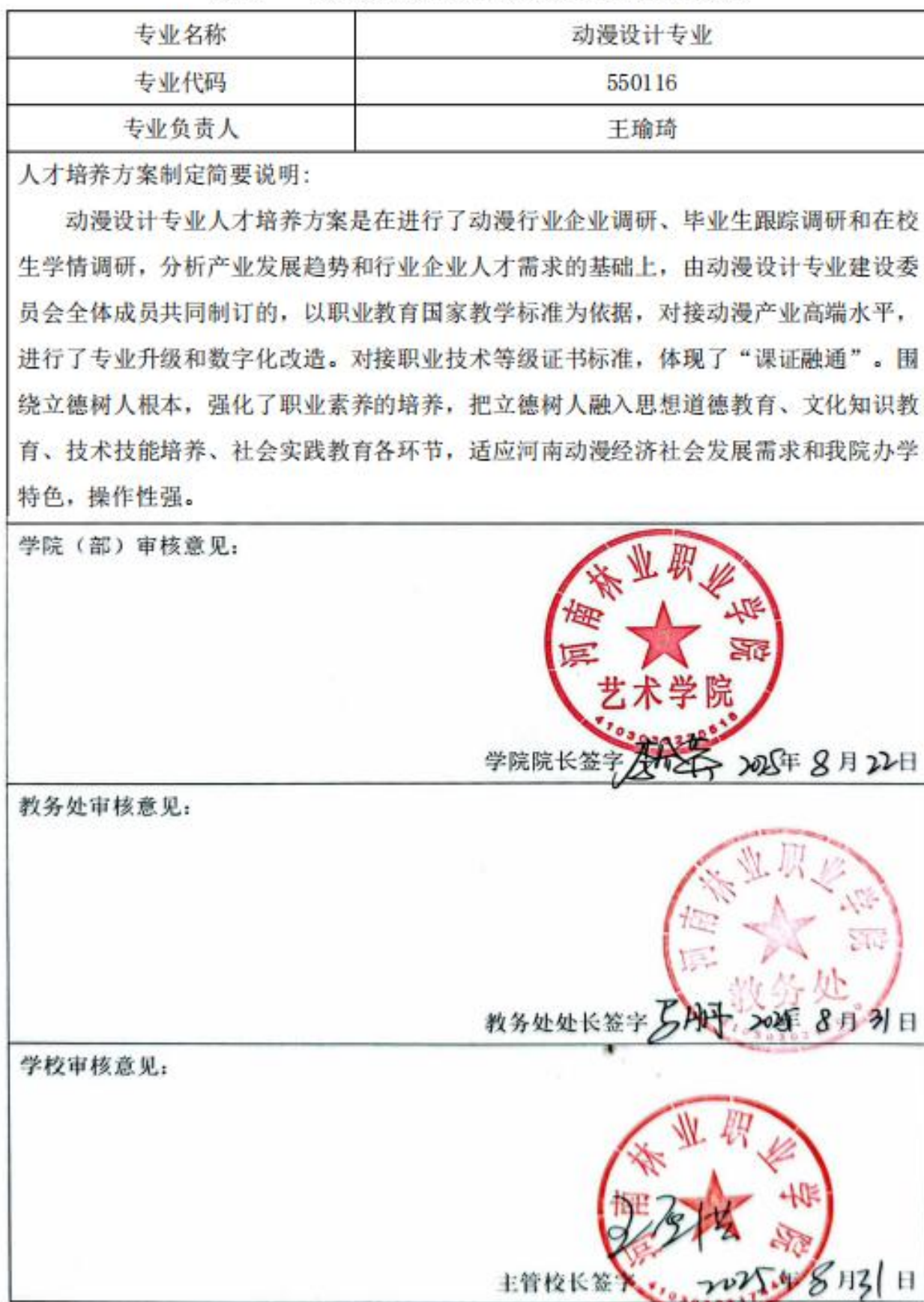
表 11 2025 级动漫设计专业人才培养方案审批表