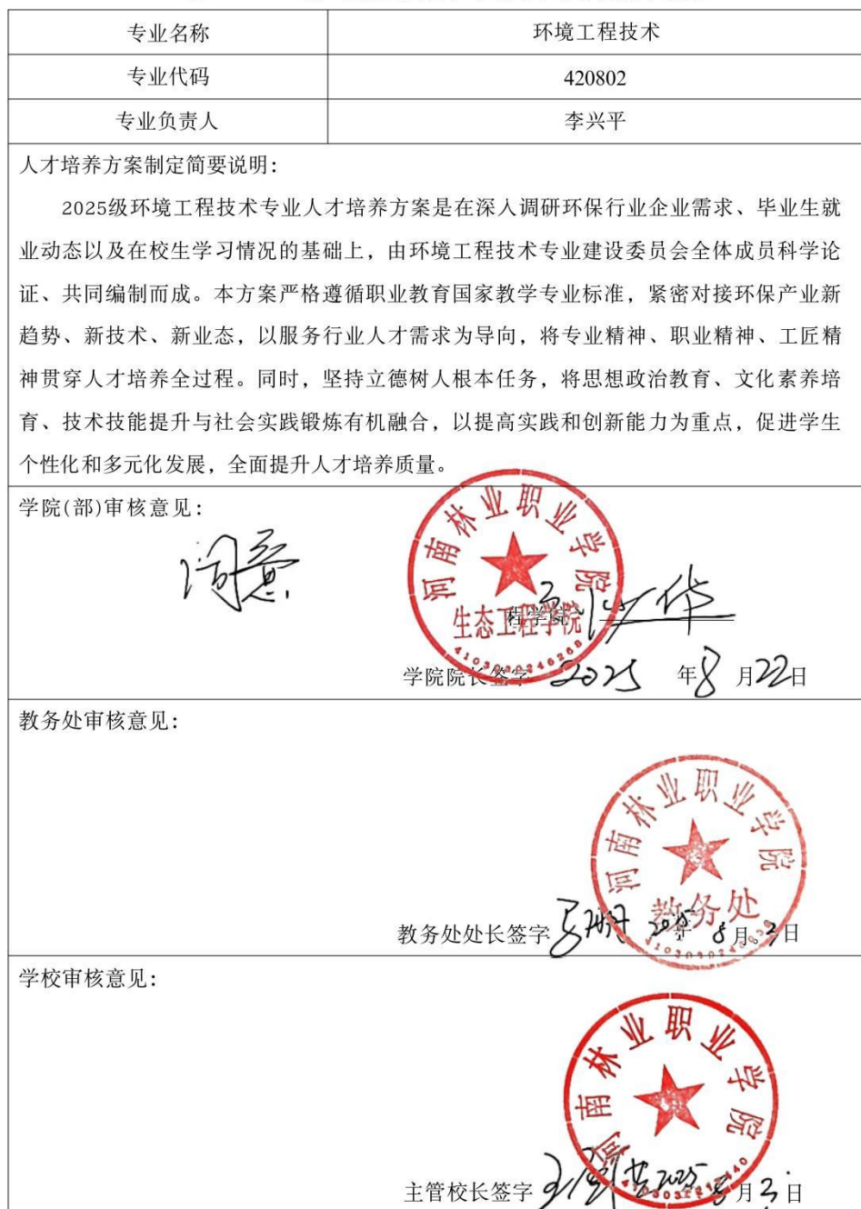
表11 2025级 环境工程技术专业人才培养方案审批表